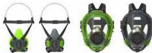
Półmaski BLS 4000 S - BLS 4000R Maski pełnotwarzowe BLS 5700 - BLS 5600